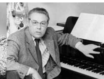
Valter Ojakäär (1923)

“Nuhkide koor” “Kuninga, Narri ja Angela trio” (tekstid Ain Kaalep) Ooperist “KUNINGAL ON KÜLM” (libreto Ain Kaalep, A. H. Tammsaare näidendi järgi, esietendus 1967. a. “Vanemuises”)