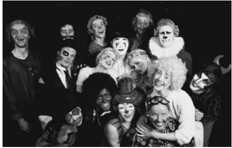
"BURATTINO" 2000. a. Tallinna Linnateatris. Osades EMA Kõrgema Lavakunstikooli XX lend.