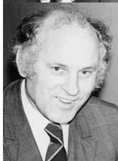
Uno Naissoo (1928–1980)

“Põhjamaa” (tekst Enn Vetemaa) Lastemuusikalist “PIPI PIKKSUKK” (libreto Astrid Lindgreni teose järgi Sulev Nõmmik ja Enn Vetemaa, esietendus 1969. a. “Estonias”)