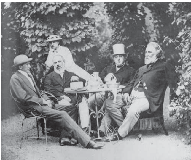
Pildil: I.S. Turgenev perekond Miljutini suvilas Baden-Badenis, 1867.