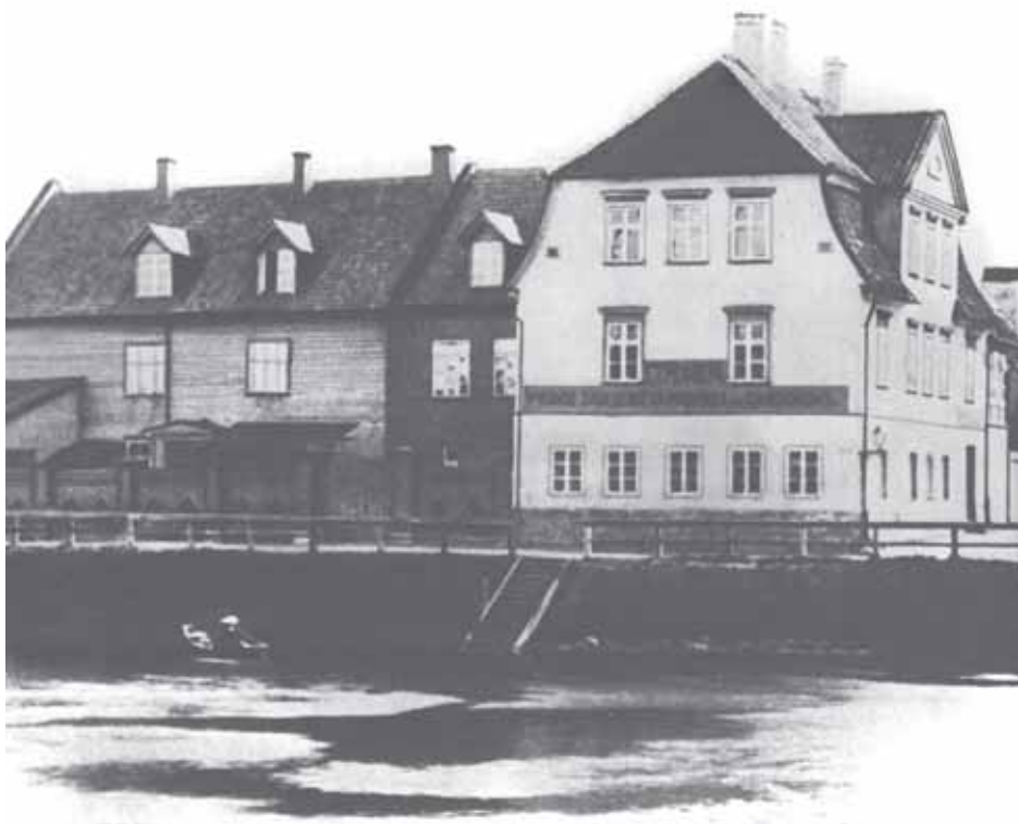
Hugo Treffneri eragümnaasiumi hoone Tartus Hobuse tn. 2