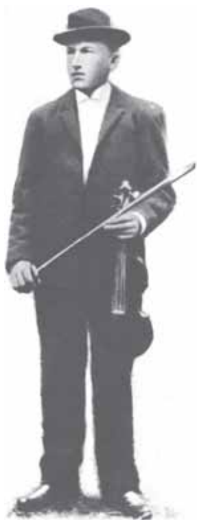
A. H. Tammsaare (1899)